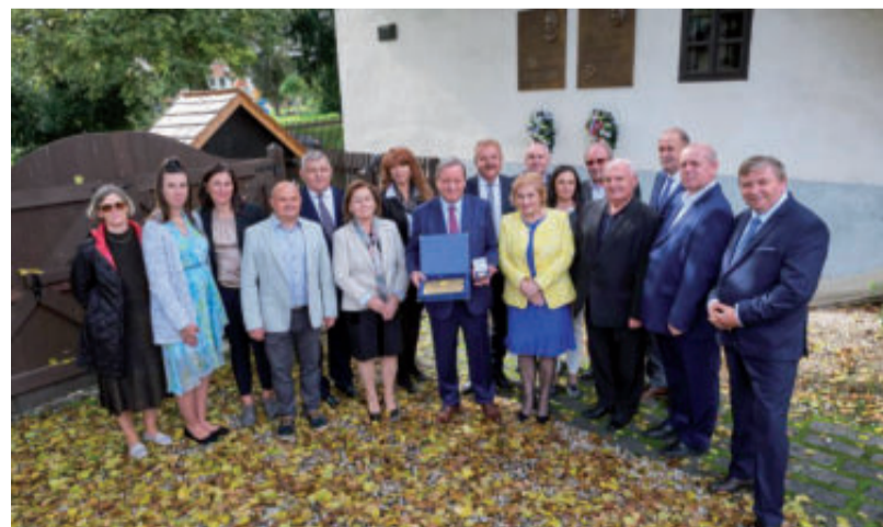
Pohľad na účastníkov slávnostného odovzdávania vyznamenání Alexandra Dubčeka Spoločnosťou slovenských veľikánov tentoraz pred rodným domom Ludovíta Štúra a Alexandra Dubčeka dňa 29. septembra 2022 v Uhrovci.