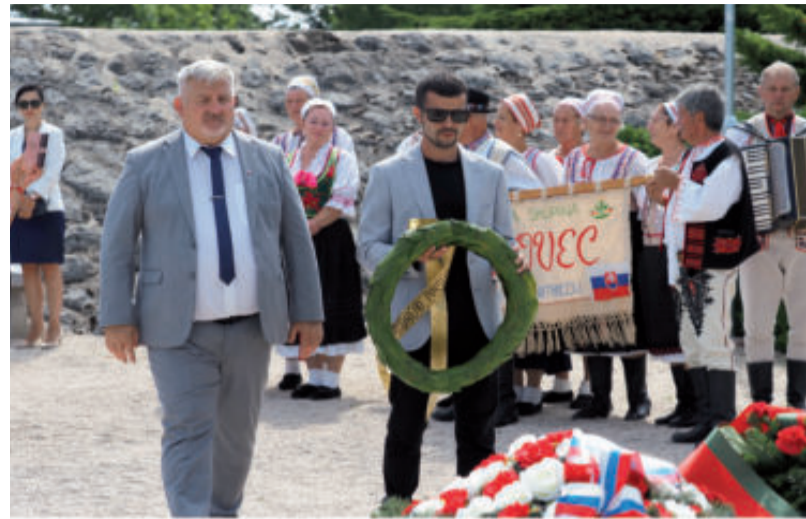
Spoločnosť Slovenských Veľikánov VI. ROČNÍK DŇA SLOVENSKÝCH VEĽIKÁNOV A SLOVANOV 29. AUGUSTA 2022 Uhrovec - Jankov Vŕšok

A čo pripomenúť záverečnými riadkami môjho videnia a vnímania tejto utešenej a nezastupiteľnej akcie v rámci tradič-