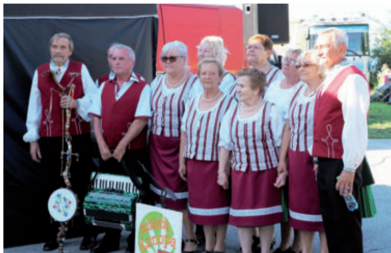
Takto sa po svojom peknom vystúpení dali pre archív Spoločnosti slovenských veľikánov zvečniť na Jankovom Vŕšku, členky a členovia folklórnej skupiny Rastislavická konopa .

teľka Galérie 73 z Belehradu Mirela Pudar, ale i ďalší vzácní hostia.