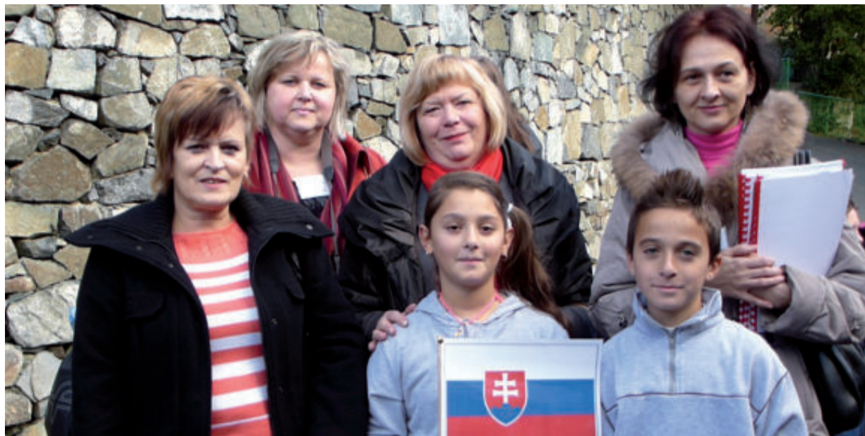
Aj z tohto záberu čítajúca a prameniaca spokojnosť učiteliek, ale i žiakov prezrádzajú, že Základná škola Československej armády v Prešove je veľmi vďačná a spokojná so svojou spolupracou na úseku realizácie kvalitných projektov s blízkym i vzdialenejším zahraničím z partnerských škôl.