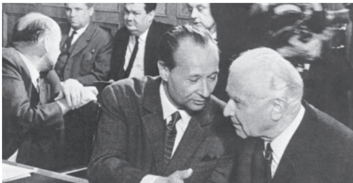
Každý rozhovor zásluhou ľudomila Alexandra Dubčeka a mnohými ešte v Československej republike uznávaného Ludvíka Svobodu, za jeho bohaté životné skúsenosti, ale i pevný charakter, aj na poste prezidenta Československej republiky, vo veľmi zložitom období, mal charakter nadstraníckosti a v prvom rade zodpovednosti za túžby väčšiny národa v tomto štáte, vtedy Čechov a Slovákov. Nie náhodou práve aj táto fotografia obletela hlavne v roku 1968 svet.