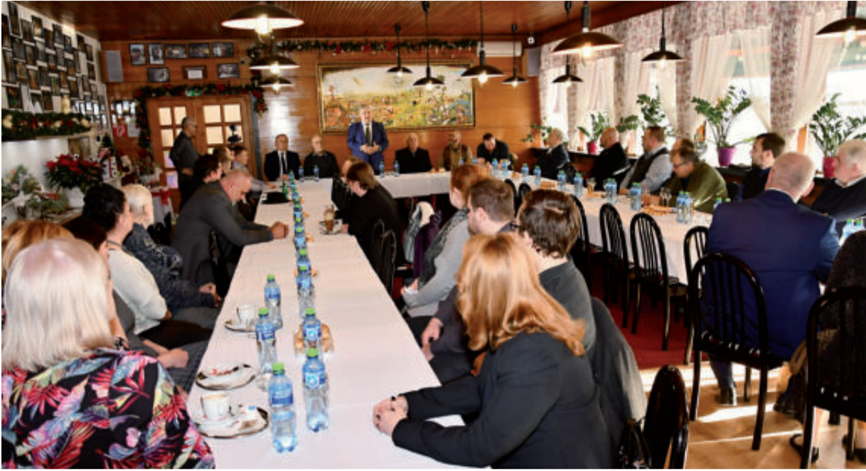
Pohľad na účastníkov vypravadenia knihy Alexander Dubček z pohľadu celosvetových politikov a osobností k čitateľovi.