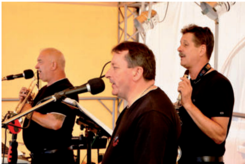
Dňa 29. augusta toho roku by sa na Jankovom vršku počas osláv Dni slovenských velikánov mala znova predstaviť i hudobná skupina Progres z Prievidze. Už dnes sa na jej vystúpenie tešia viacerí jej milovníci.