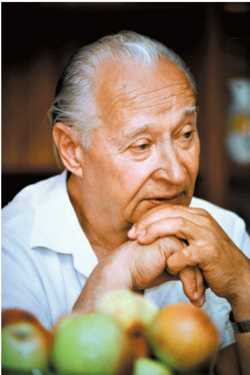
Alexander Dubček, politik, demokrat, humanista počas jednej z pracovných úvah nad budúcnosťou.